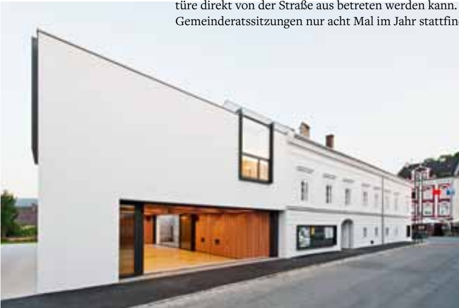
Gemeindeamt Planung SUE Architekten Baujahr 2010

Kerne sind oft klein und brauchen eine harte Schale. Bei uns sind es 20 bis 40 Personen im Kern, die seit Jahren intensiv an der Zukunft mitdenken und mitarbeiten.