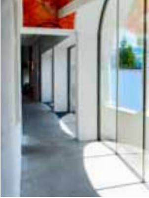
Gemeindeamt Planung SUE Architekten Baujahr 2010