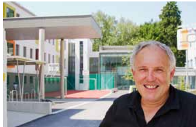
Umbau Neue Mittelschule mit öffentlichem Ballspielplatz Planung Adalbert Böker Baujahr 2012