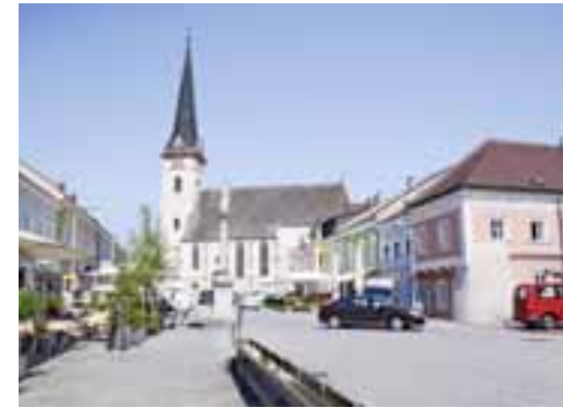
Marktplatz Planung Boris Podrecca Baujahr 2001