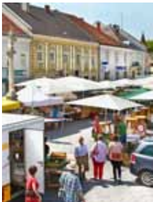
Der Wochenmarkt belebt den Ortskern jeden Freitag Nachmittag.